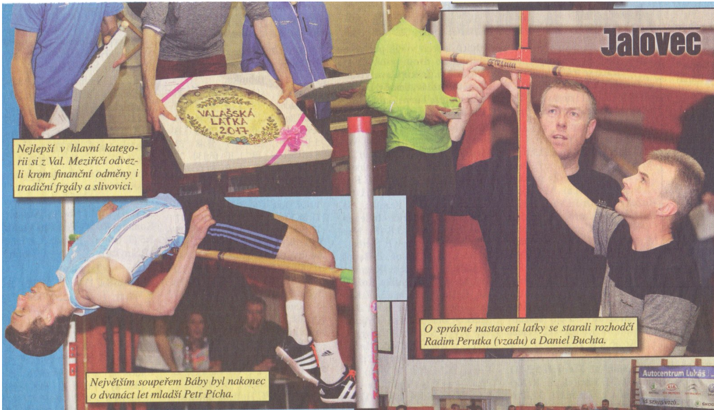
Nejlepší v hlavní kategorii si z Val. Meziříčí odvezli krom finanční odměny i tradiční frgály a slivovici.