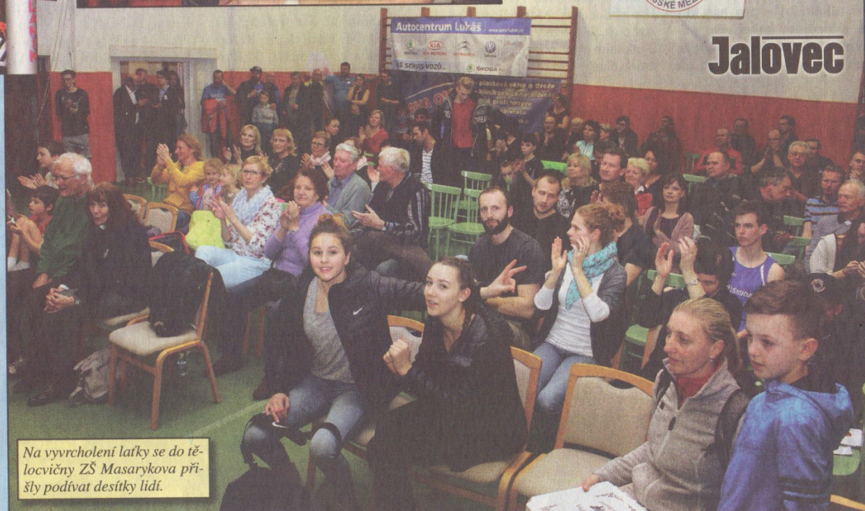
Na vyvrcholení lačky se do tělocvičny ZŠ Masarykova přišly podívat desítky lidí.