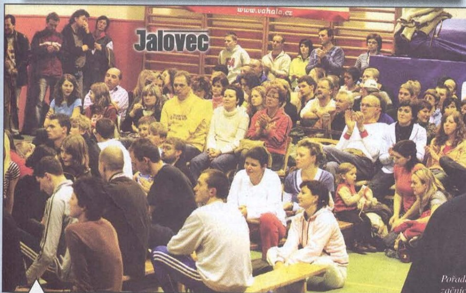
Pořadatelé se organizačních povinností chopili naprosto precizně.

Tradiční valašská latka v Meziříčí táhne. Letošní zájem diváků to jen potvrdil.