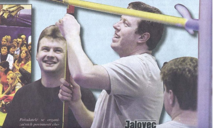
Přidatelé se organizačních povinností chodili... ...